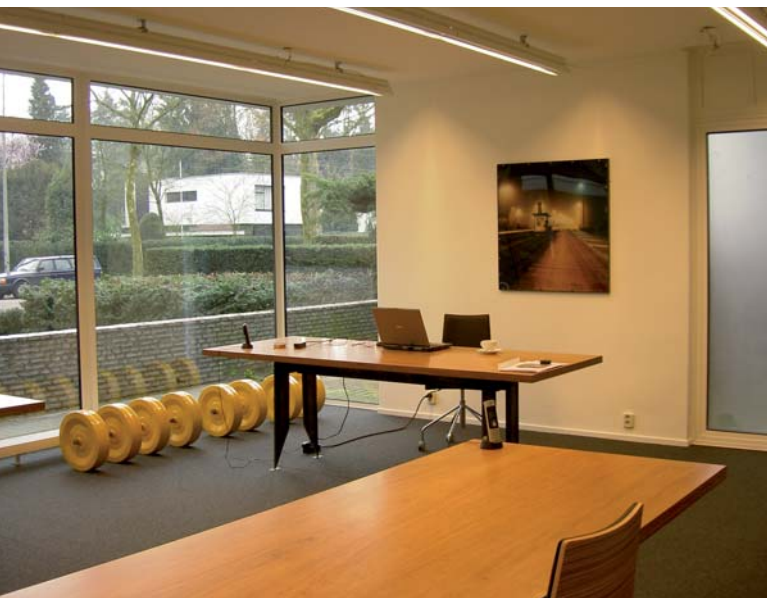
LEF kantoor 1, exterieur en interieur