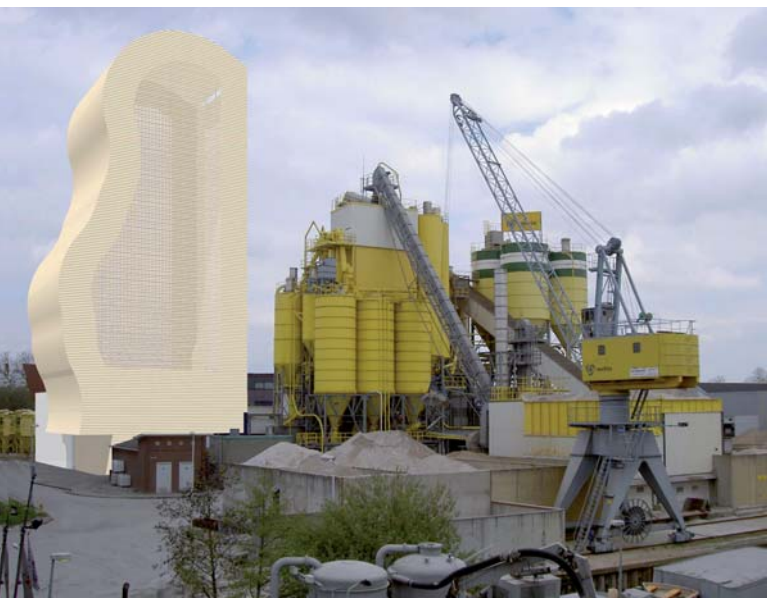
productietoren beamix-maxit eindhoven: ontwerp 1 huid textiel, 2006 / ontwerp 2 huid profielplaat, 2007