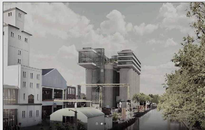
impressie 'silotel' - © architecten Cie